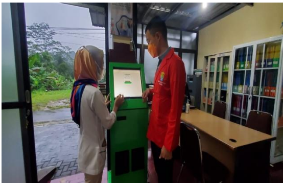
Gambar 2 : Pendaftaran Pasien secara Online system BPJS.