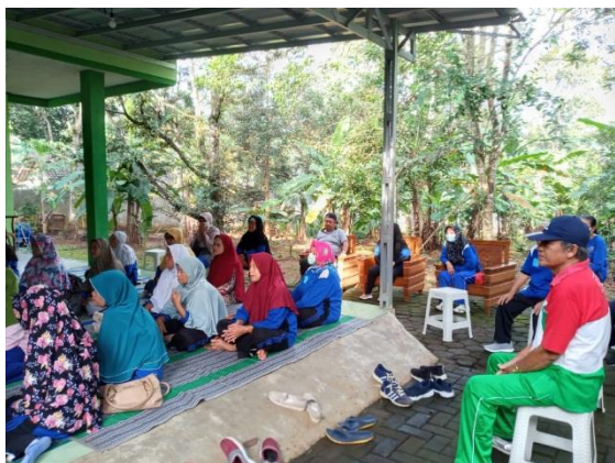
Gambar 3 : Peserta Penyuluhan Hukum bagi Warga Pasien Prolanis Klinik Pratama RAHMATIKA Semarang.