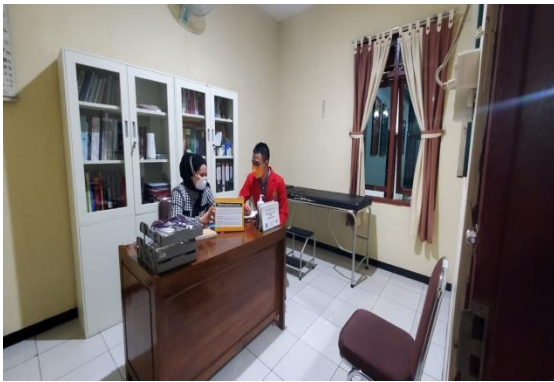
Gambar 4: Dokter memberikan bimbingan untuk melakukan pemeriksaan pasien.