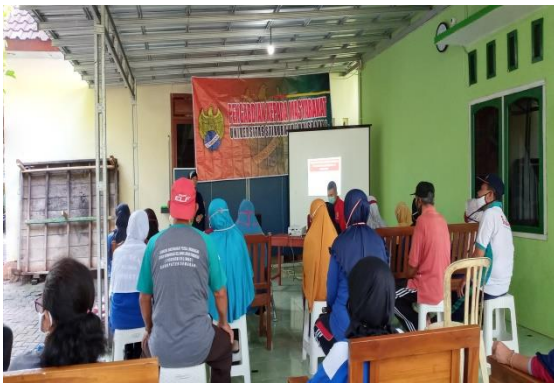
Gambar 1 : Persiapan Pelaksanaan Penyuluhan