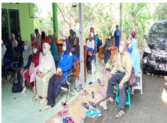
Gambar 5 : Peserta Penyuluhan Hukum di foto dari berbagai sudut ruang terbuka.