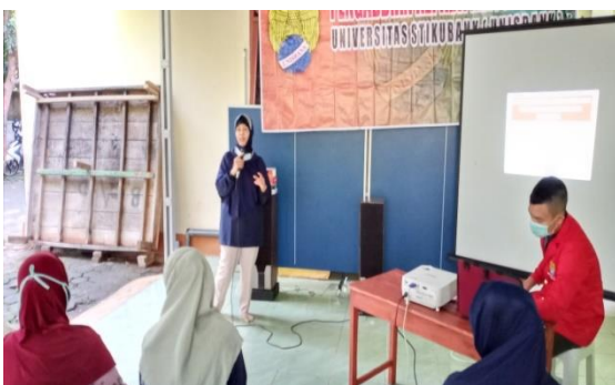
Gambar 2 : Pelaksanaan Penyuluhan hukum.