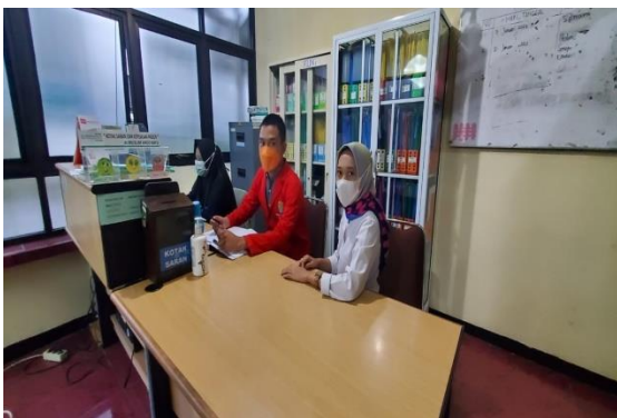
Gambar 2 : Pelayanan Pasien untuk dicatat oleh Petugas Aministrasi .