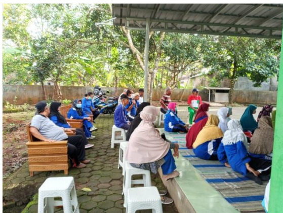
Gambar 4 : Peserta Penyuluhan Hukum difoto dari berbagai sudut ruang terbuka.