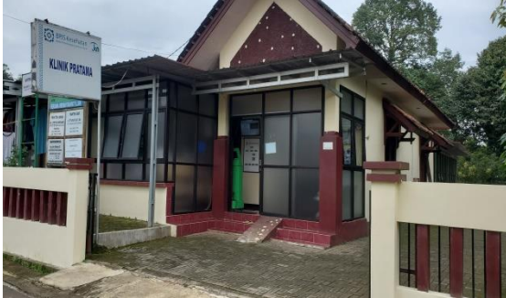
Gambar 1 : Gedung Klinik Pratama RAHMATIKA Semarang.